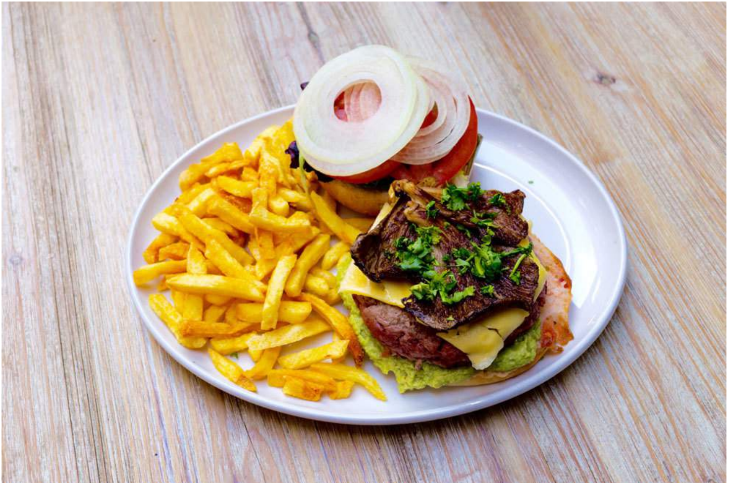
La apetecible Hamburguesa Lady Grantham's: ternera 100% ecológica con guacamole del chef, un toque picante y boletus, de Alta Burgersía (Plaza Matute, 5. Madrid).

En Alta Burgersía (Plaza Matute, 5. Madrid), además de saborear unas riquísimas croquetas de boletus, te espera la hamburguesa del otoño. ¡Todo un capricho para paladares gourmet! La más que apetecible Lady Grantham's se prepara con ternera 100% ecológica con guacamole del chef con un toque picante, cilantro, boletus, queso holandés, lechuga, tomate y cebolla.