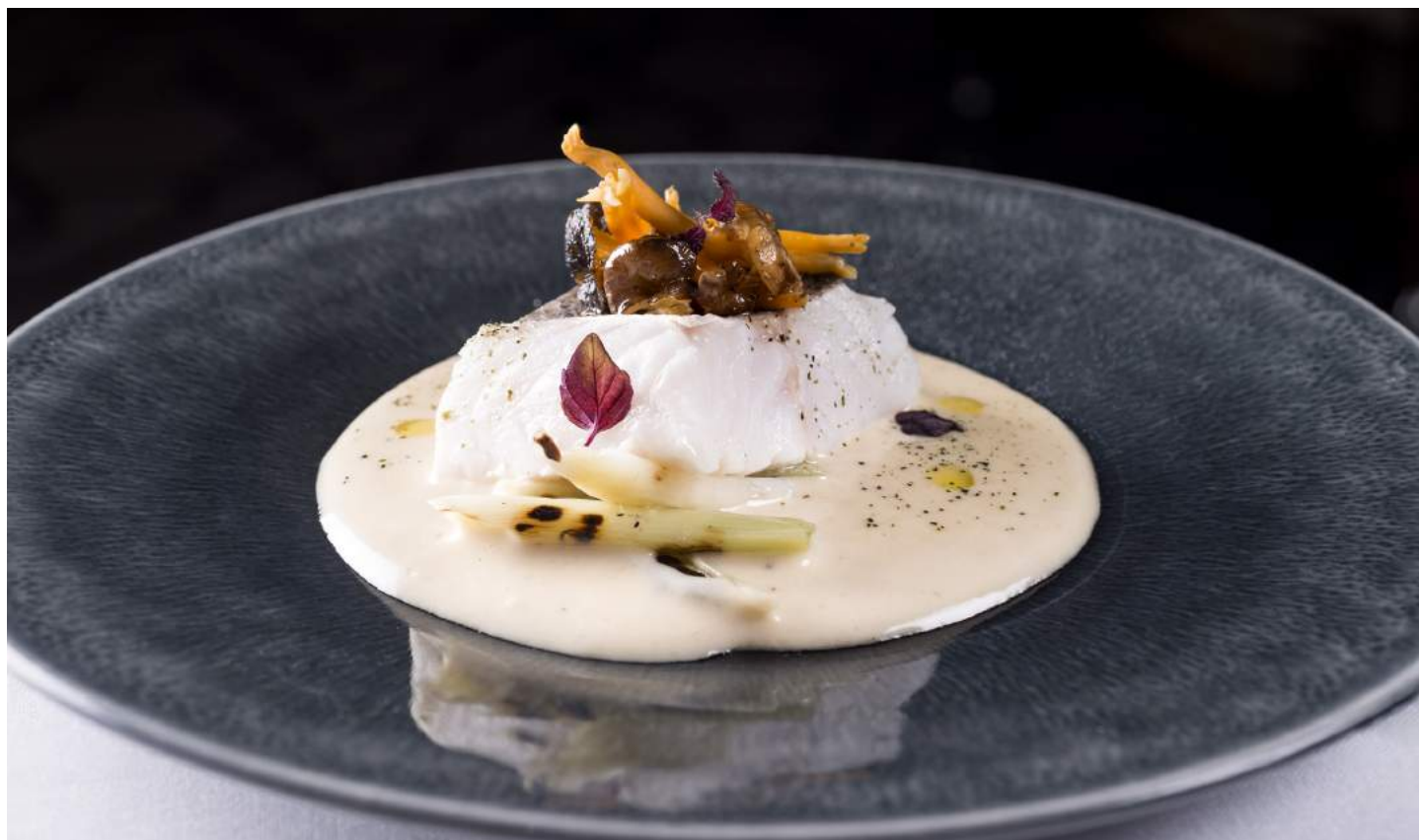
Merluza de pincho con pilpil de setas, angula de monte y ajetes salteados, del Hotel Villa Magna (Castellana, 22. Madrid).