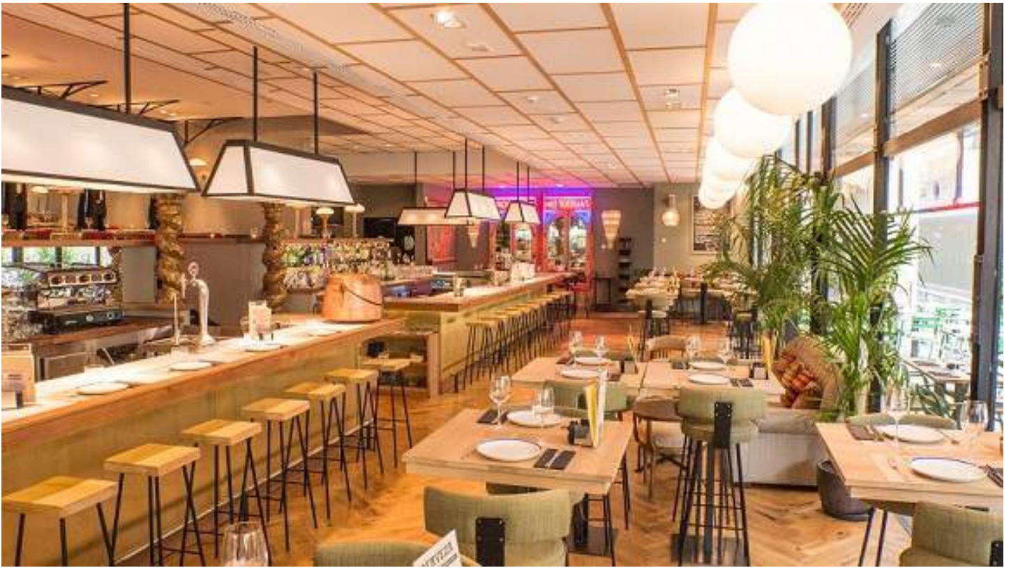
Restaurante Makkila (Núñez de Balboa, 75. Madrid)