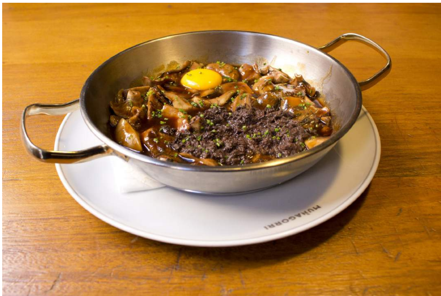
Cazuela de níscalos con morcilla de Beasain, jugo de caza y yema de caserío, de Muñagorri (Padilla, 56. Madrid).