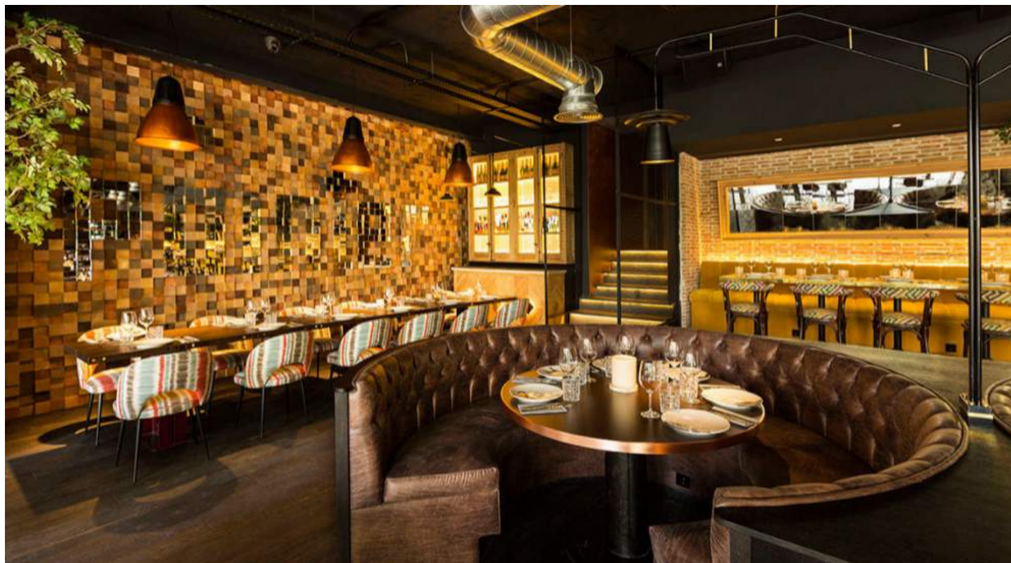
Sala del restaurante Pointer (Marqués de la Ensenada, 16. Madrid).

Recién inaugurado, Pointer (Marqués de la Ensenada, 16. Madrid) no podía dar mejor bienvenida al otoño que con recetas en las que el producto de mercado y de temporada es protagonista. Siguiendo los pasos de su hermano mayor, Teckel, este espacio se presenta bajo la dirección gastronómica del chef César Galán. Y si de setas hablamos, que nadie se mueva de la mesa sin probar su risotto de pichón y setas, toda una aventura a la mesa.