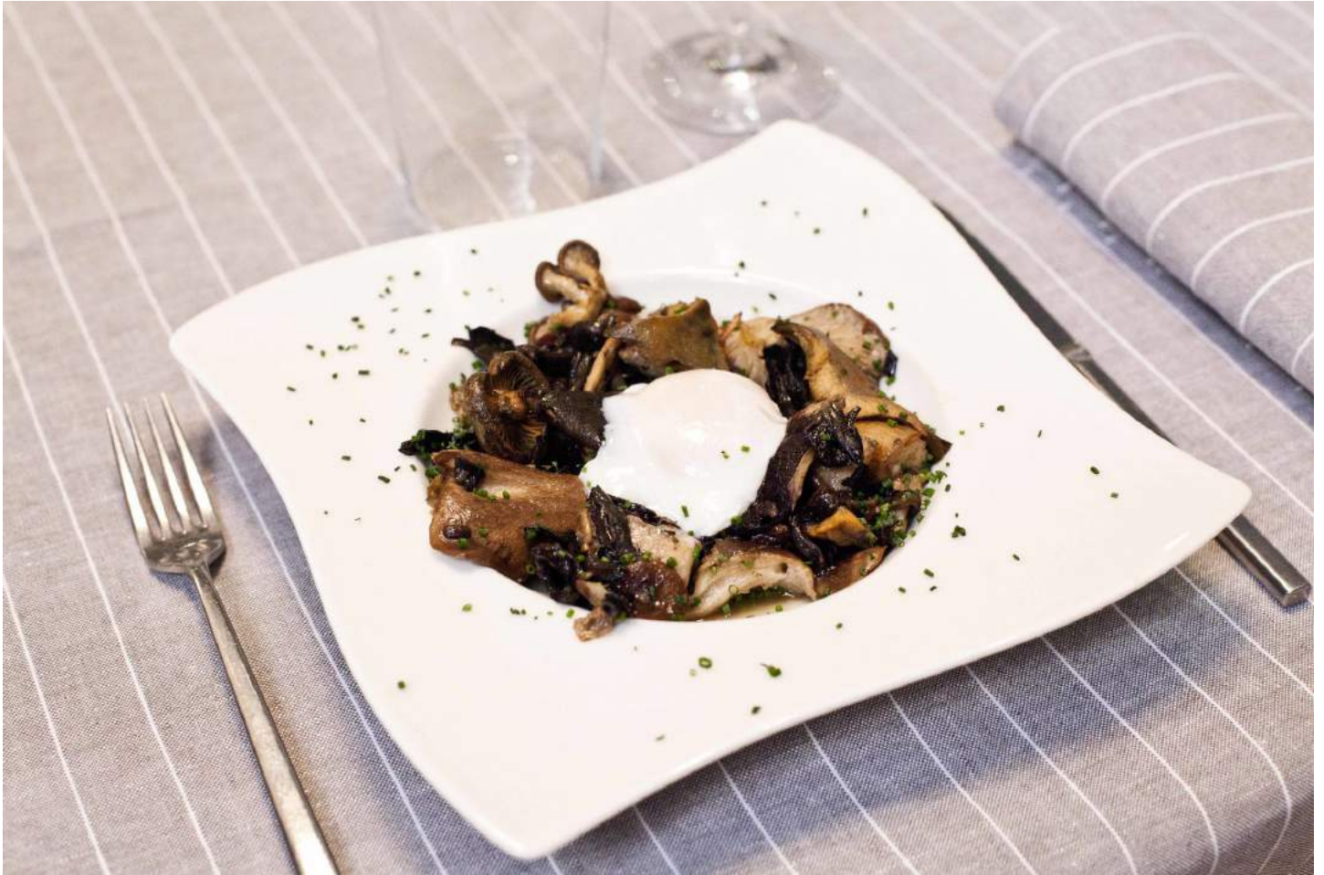
Setas salteadas de Urkiola Mendi (Cristóbal Bordiú, 52. Madrid).

En el madrileño barrio de prosperidad, Urkiola Mendi (Cristóbal Bordiú, 52. Madrid) es todo un referente de la gastronomía vasca y los sabores auténticos. En otoño, las setas se preparan salteadas, en revuelto, con huevo escalfado, en carpaccio, en guisos (como unas patatas con costillas y níscalos) o como guarnición de platos como el bacalao o el jarrete de cordero pré-salé, una pieza muy especial ya que procede del Mont Saint-Michel (Francia).