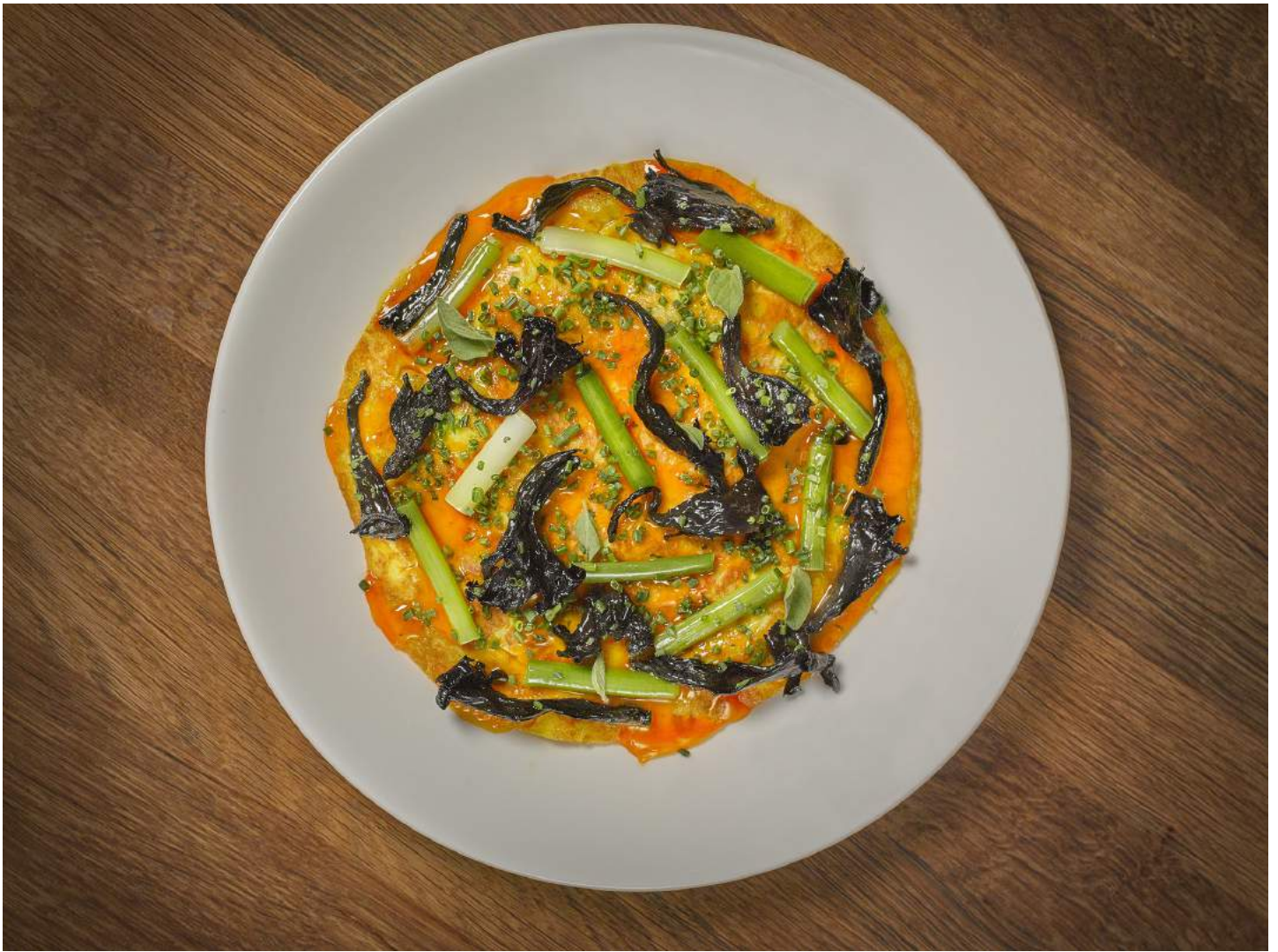
Tortilla de ajetes, setas de cardo y yema de huevo de corral, en Al Trapo (Gran Vía, 11. Madrid).