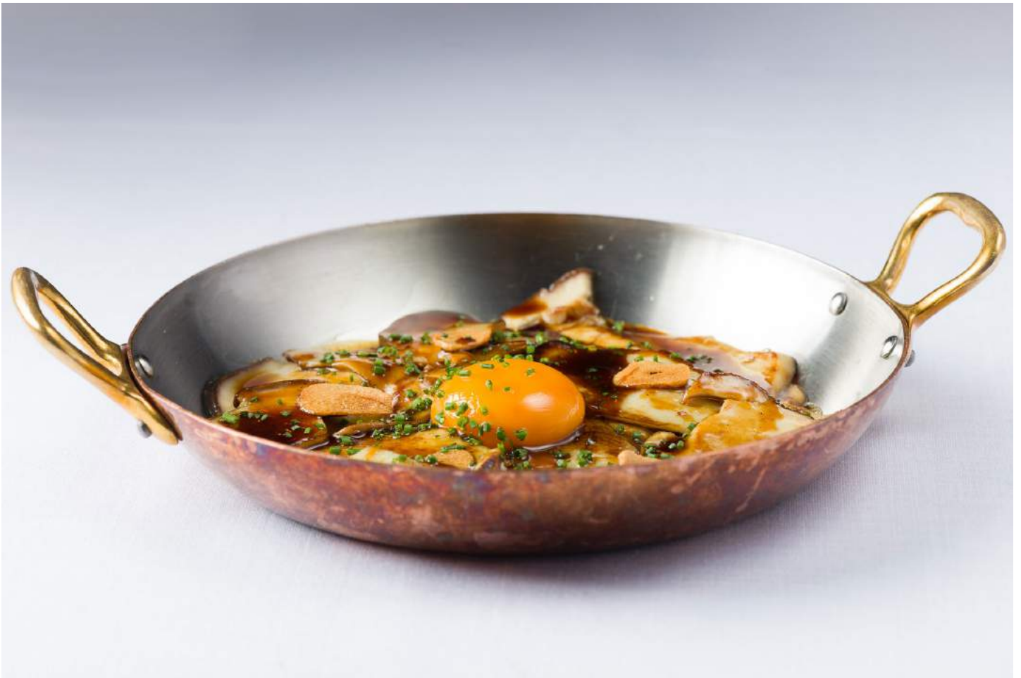
En Tatal (Castellana, Madrid) se pueden saborear estos deliciosos boletus salteados con trufa y yema de huevo